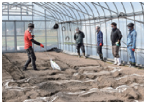
▲農場の研修生が農薬の袋を畑の上を引きずるように散布し被覆後、水封をしました。

同グループは、過去数年にわたり土壌菌密度調査を実施しており、フザリウム菌の占める割合が高い状況です。昨年、販売高1億円を3年ぶりに達成しましたが、土壌病害に悩まされる圃場もあり、同農場ではフザリウム菌由来の萎凋病と思われる症状も発生。安定した生産を目指すなか基礎となる土