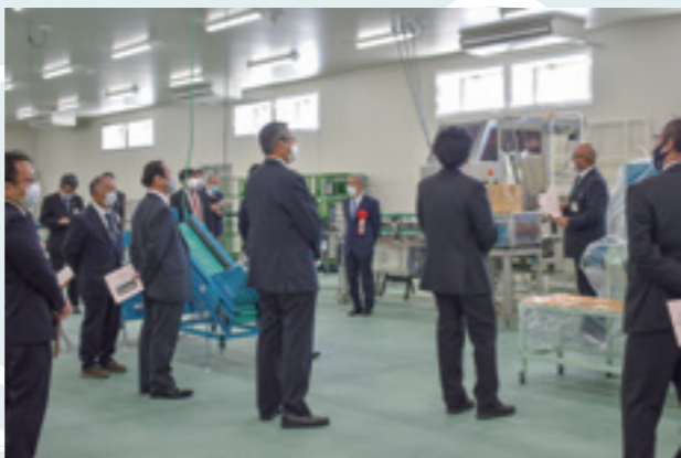
選果場内の機器も披露しました。