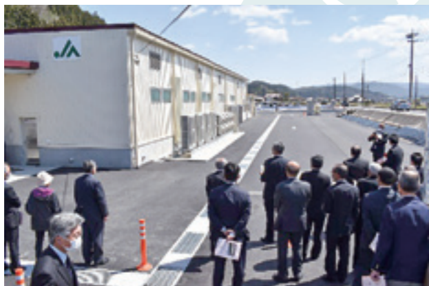
式の後には内覧会で施設を説明

さらなる産地化への中心施設の建設が必要となることから検討を重ね、主に同町大朝地区で栽培され、大朝野菜集荷場で選果を行なっているキュウリも同じ場所に集約することで、集荷・選果場の再編を行ない、将来的な広域利用も視野に入れます。