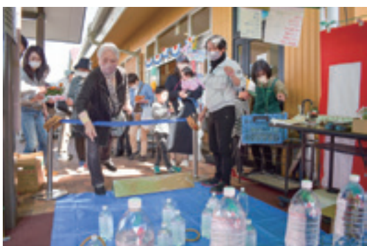
▲輪投げで賞品ゲット！人気賞品は卵でした。

店内では野菜や果物が詰まった「500円バケツ」や合併したJAの特産品を販売。また、店先ではげんざいの無料配布や豪華賞品が当たる輪投げなどに多くの人が集まりました。県内18カ所では、スタンブラリーも開催され、すてきな賞品が当たる企画も行なわれました。