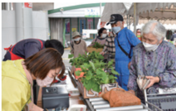
▲たくさんの方で賑わいました。

また、新型コロナウイルスによる規制も緩和された今年のグリーンフェスタでは、柑橘の販売や米のすくい取りなども行なわれ盛り上がりしました。